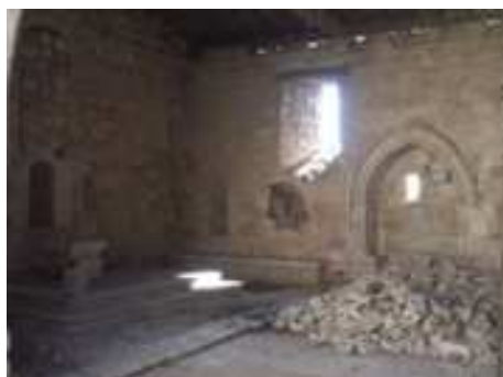
Enfeu (niche surmontée d'arcade destiné à abriter un tombeau)