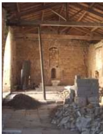
Vue intérieure d'ensemble